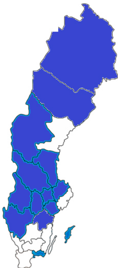
Figur 1. Karta som visar geografisk täckning för nätverkets näringslivsinriktade projekt under 2014.

Både noden och de regionala projekten har dessutom deltagit på och arrangerat ett stort antal seminarier och möten med lokala politiker, kommunala tjänstemän, företag, intresseorganisationer m.m., för att diskutera näringslivsutveckling och affärsmöjligheter vid etableringar av vindkraftverk.